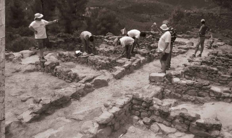
La Gessera, Caseres