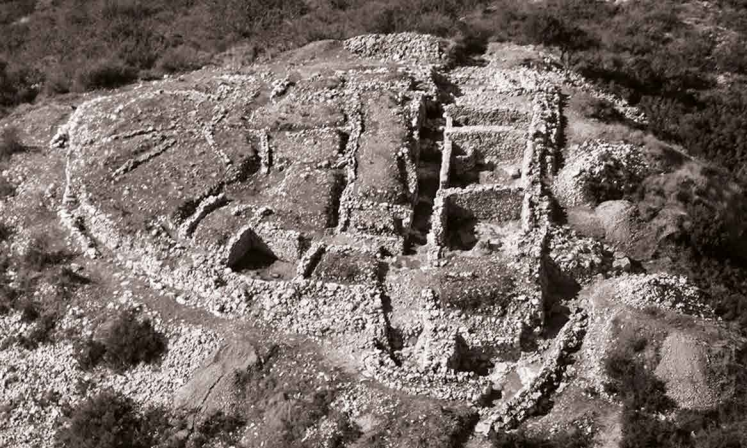
Sant Jaume - Mas d'en Serrà, Alcanar