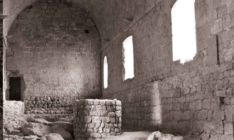
Castell de Miravet